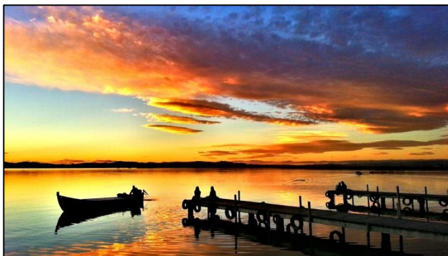
Fotografía de Oliver