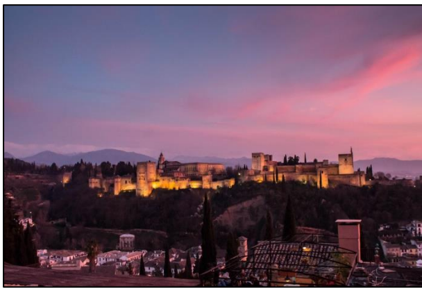
Fotografía de David Maldonado