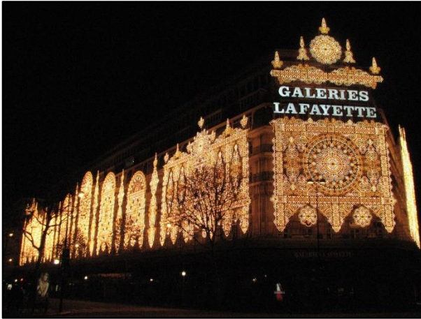
Galerías Lafayette, foto de Cindy --

¡Hola, amantes de las compras! Sabemos que os encanta gastar en tiendas, probaros los modelitos más trendy y os podéis tirar horas con vuestras amigas paseando por centros comerciales... Por ello, desde minube, os queremos mostrar algunos del mundo que no os podéis perder. ¡Atentas!