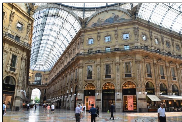
Galería Víctor Manuel II

Nada tiene que envidiar, sin embargo, la famosa Galería Víctor Manuel II . Situada en la glamurosa Milán, los habitantes la conocen como el "salón de Milán", por su techo abovedado de hierro y arcos de cristal. El lugar derrocha elegancia y gran clase, y contiene tiendas de grandes marcas como Prada, Louis Vuitton o Gucci. Además de los exquisitos restaurantes que encontraremos en el recorrido, este centro comercial hospeda el primer hotel del mundo en ser catalogado con 7 estrellas. El lujo está servido.