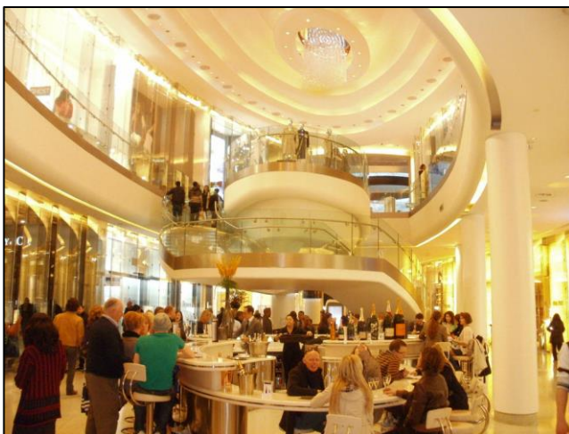
Westfield London

los bares hasta las tiendas, pasando por hoteles, restaurantes... todos estos establecimientos los puedes disfrutar en el famoso Westfield London , uno de los principales destinos de compras y ocio de la capital inglesa. Situado apenas a 15 minutos de Oxford Circus, cuenta con más de 300 tiendas para el disfrute