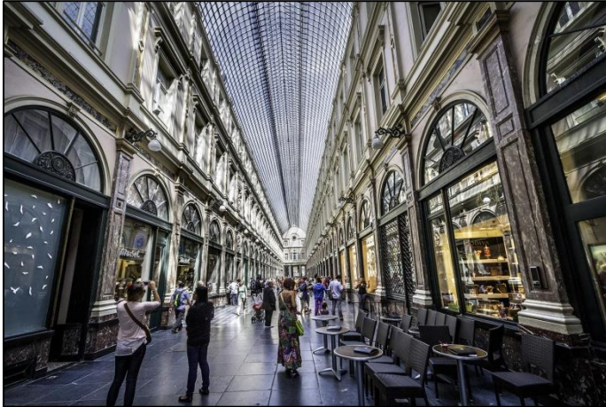
Galerías Reales de San Huberto

Otro lugar europeo lleno de elegancia y clase son las Galerías Reales de San Huberto . Localizadas en Bruselas, fueron diseñadas en 1947 y se convirtieron en las primeras galerías comerciales en Europa. Este centro comercial se divide en tres zonas: la Galería de la Reina, la del Rey y la Galería de los Príncipes. En el interior reina muchísima tranquilidad, y paseando podremos contemplar exclusivas tiendas de moda, escaparates de locales lujosos o cafeterías de mucha calidad.