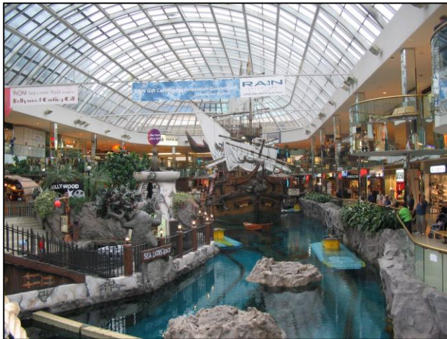
West Edmonton Mall Inn

de visitantes de todo el mundo. Tiene una pista de hielo, un zoológico, un lago enorme y más de 800 tiendas... simplemente único. Se encuentra en Alberta (Canadá) y tiene una extensión de casi 500.000 m 2 , y cuenta con el hotel 'Fantasyland', donde podrás alojarte en habitaciones temáticas (lejano oeste,