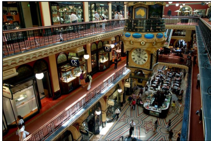
Centro Comercial Queen Victoria

polo norte, coches de carreras...). Además, cuenta con una réplica exacta del 'Santa María', el barco en el que navegó Cristóbal Colón en 1492, anclada en el lago interior más grande del mundo. ¿Necesitas más motivos para ir un día de compras al West Edmonton? Creemos que no, pero puedes visitar minube para terminar de planificar tu viaje. Estamos seguros de que no te decepcionarás.