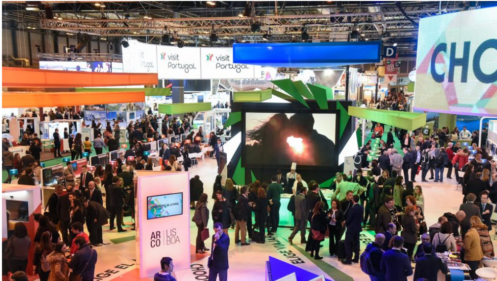
Fitur abre sus puertas desde hoy hasta el 22 de enero (Ifema)

La 37ª Feria Internacional del Turismo abre sus puertas desde hoy hasta el 22 de enero