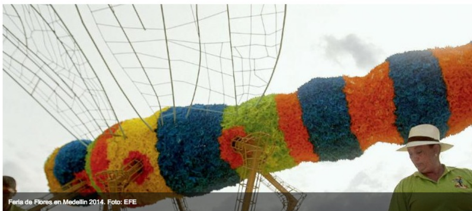
Feria de Flores en Medellín 2014.